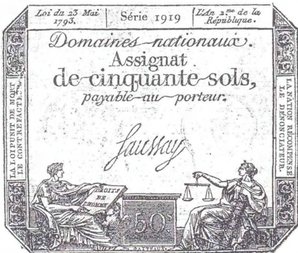
Afb. 2 Een tweetal assignaten uit de honderden exemplaren die nog in diverse bestanden in het Stadsarchief aanwezig zijn.

Over de meest uiteenlopende zaken werd informatie gevraagd, want de bevrijders waren graag van alles op de hoogte. Er werden lijsten aangelegd van bakkers, korenkopers, apothekers, slagers en schippers. Niemand kwam de stad in of uit zonder geldig paspoort van de Fransen. Kennelijk was dit systeem niet waterdicht, want de garnizoenscommandant wenste ook iedere avond een opgave van de namen en hoedanigheid van